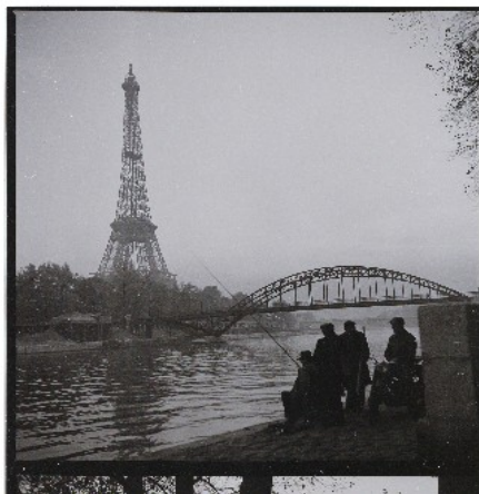
PARIS gesehen von John Palatinus, 1954