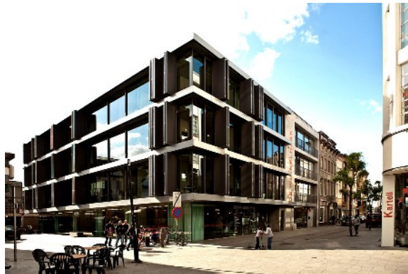
Designzentrum Antwerpen www.winkelhaak.be

Am 12. Mai findet in Anwesenheit des Künstlers die zweite große Ausstellungseröffnung im Designzentrum Antwerpen www.winkelhaak.be statt. Auch in Belgien wird das Ereignis mit großer Unterstützung der Gay-Community realisiert. Und so verwundert es nicht, dass durch Einbindung in den Antwerpen-Pride letztendlich mehr als tausend Besucher die Ausstellung besuchen.