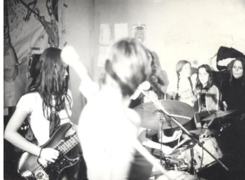
Frauenfest im LAZ, 1973.