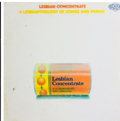
Plattencover: Lesbian Concentrate – A Lesbian Anthology of Songs and Poems, 1977.