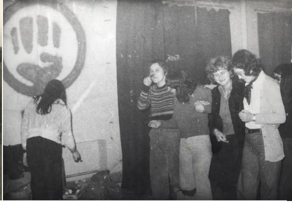
Fest im LAZ, 1974.