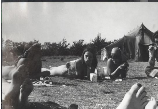
Frauen camp Femø, Dänemark, 1974.