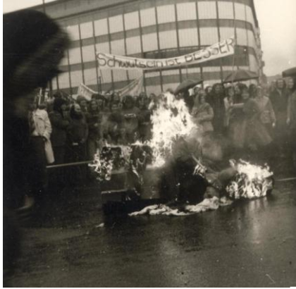
Schwul sein ist besser , Aktion auf dem Wittenbergplatz-Berlin anlässlich des Izhoe-Prozesses gegen zwei Lesben, 1974.