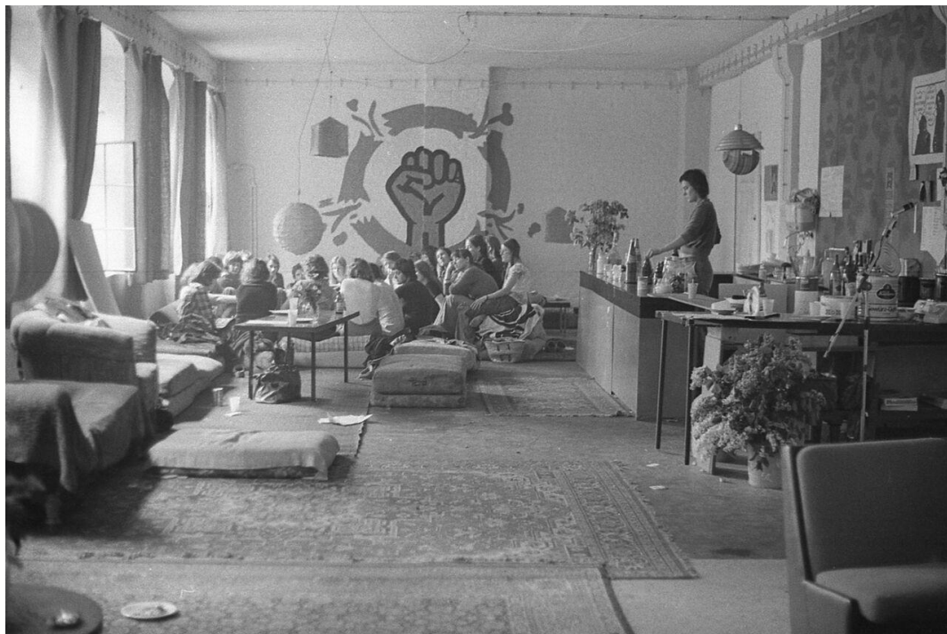
Gruppentreffen im LAZ, Kulmerstraße, Berlin-Schöneberg, 1973.

Zur Geschichte des Lesbischen Aktionszentrums (LAZ) und der HAW-Frauengruppe, 1972-1982