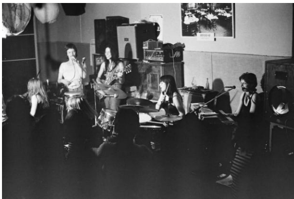
Frauenfest Tarantel, Berlin-Kreuzberg 1974, mit den Flying Lesbians.